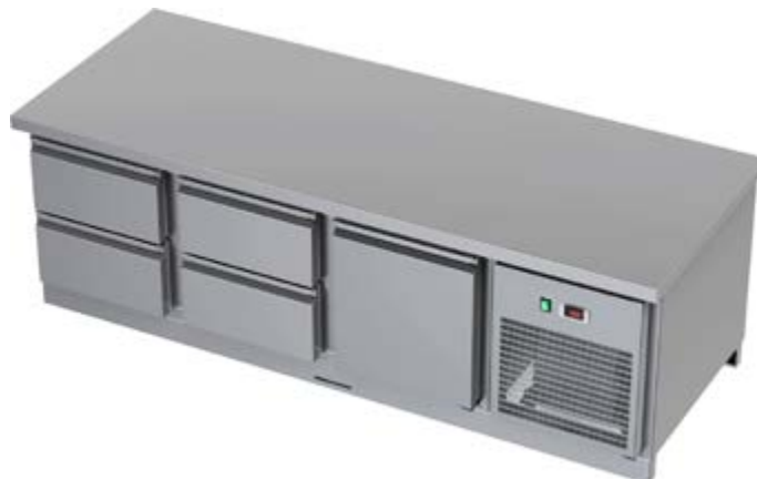
CHSD 31 kc 1800×700×600